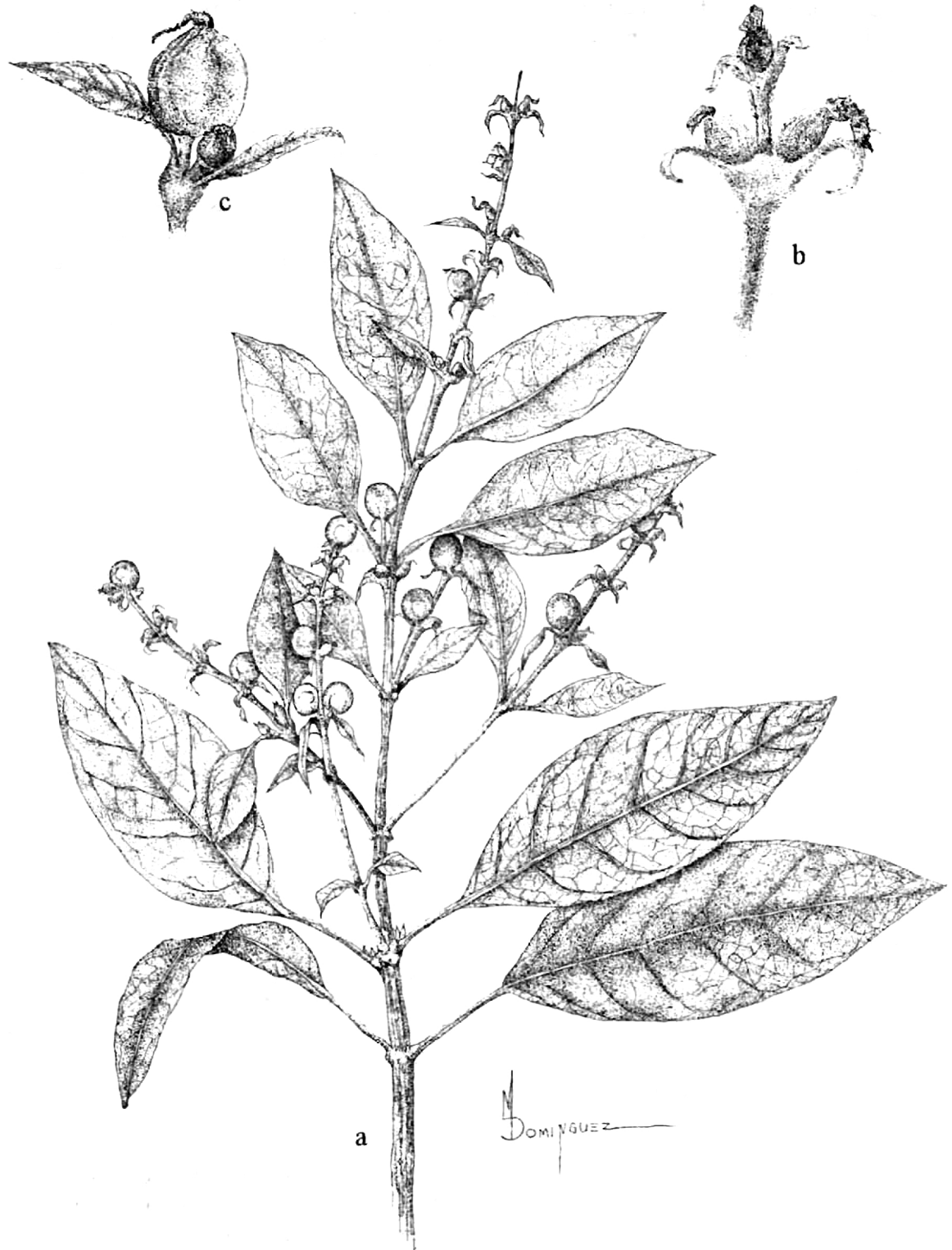
Garrya longifolia a) Rama con estructuras reproductoras. b) Detalle de la flor pistilada. c) Detalle del fruto. Basado en N. Diego 7072.